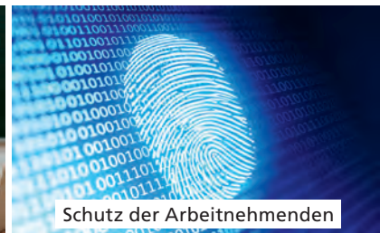
Schutz der Arbeitnehmenden